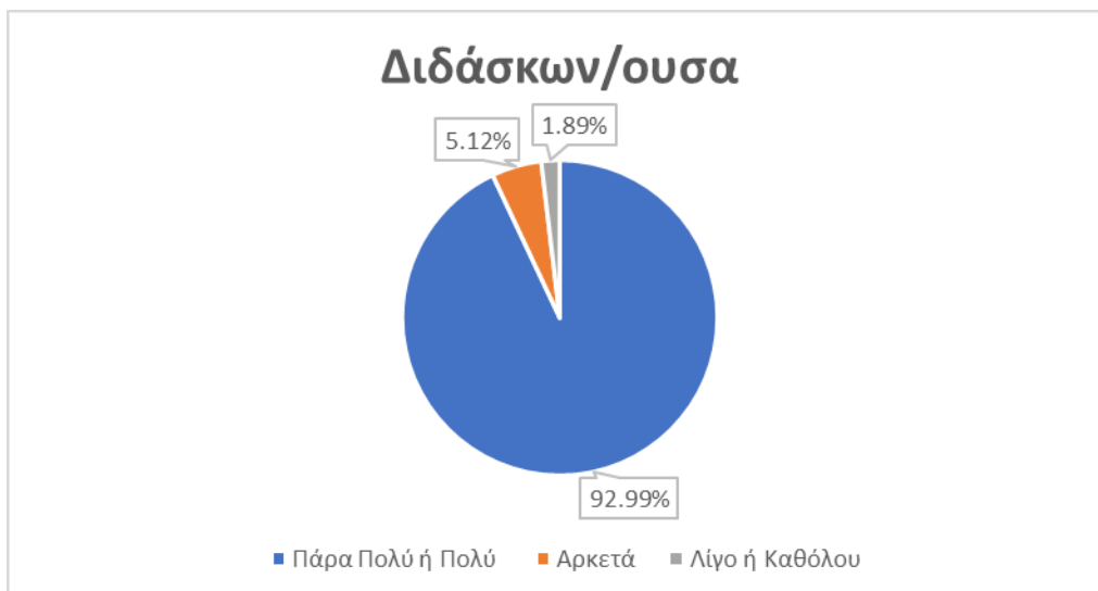
Γράφημα 2: Συγκεντρωτικά αποτελέσματα αξιολόγησης της παραμέτρου «Διδάσκων/ουσα»

Με βάση τις απαντήσεις των φοιτητών/τριών στα ερωτηματολόγια του ακ. έτους 2021-2022 σχετικά με τον αν τους ικανοποίησαν η μεταδοτικότητα, οργάνωση, συνέπεια των διδασκόντων, κλπ, ποσοστό 92,99% των απαντήσεων αντιστοιχεί στις κλίμακες «Πολύ» (4) και «Πάρα πολύ» (5), και 5,12% των απαντήσεων αντιστοιχεί στην κλίμακα «Αρκετά».